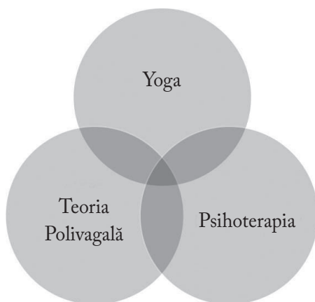
Figura 1.1 Yoga, Teoria Polivagală și psihoterapia

Această carte are drept centru de interes intersecția dintre PVT, yoga și psihoterapie. O altă modalitate de a formula această idee este prin a spune că lucrăm cu punctul în care se întâlnesc știința, corpul și sufletul.